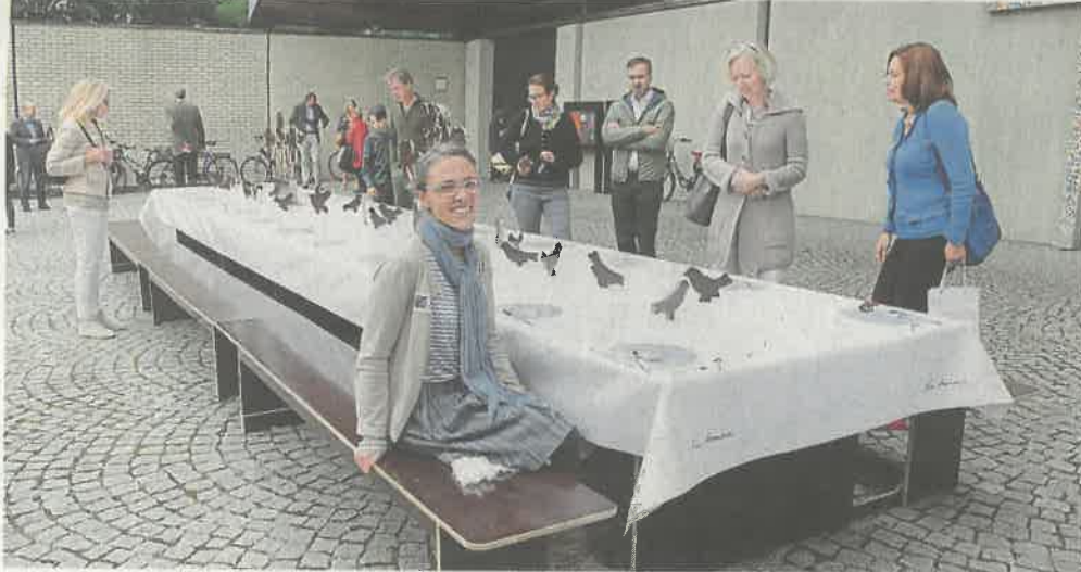
„Gastfreundschaft braucht ein Zuhause“ heißt das Werk der Künstlerin Nuë Ammann auf dem Vorplatz von St. Stefan in Gräfelfing – eine festlich gedeckte Tafel für 24 Personen mit 24 collagenartigen Gedecken, die jedes ein Sinnspruch ziert.